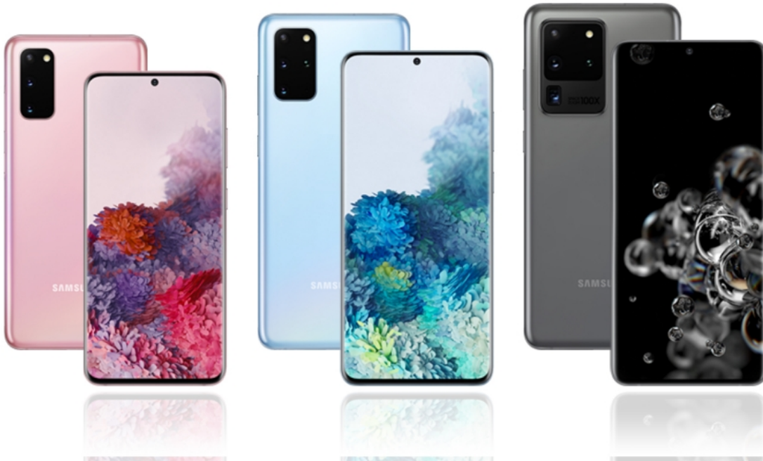
Samsungin helmikuussa julkaistu Galaxy S20 -puhelin sarja.