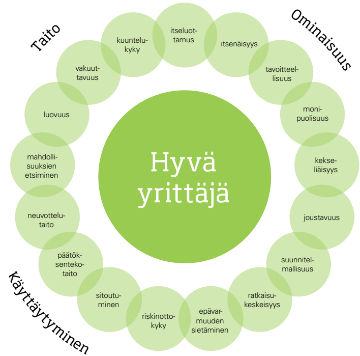
Kuva 4. Yrittäjä-kukka: Hyvän yrittäjän taitojen, ominaisuuksien ja käyttäytymisen kartta. Mukailen Järvi 2013 / Gibb 1993.

Kokemukseni mukaan yrittäjyysopintojen alkaessa opiskelijoiden yleinen käsitys on, että hyvän yrittäjän keskeisimmät taidot liittyvät liiketalouteen ja varsinkin talousosaamiseen. Kuitenkin kyse on pitkälti myös