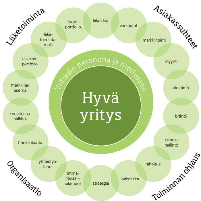
Kuva 5. Yritys-kukka: Hyvän yrityksen rakennuspalikat (Huhtaniska 2013).

toiminnallisista taidoista: mahdollisuuksien havaitsemisesta, ideointikyvystä, riskin ottamisen kyvystä ja taidosta hyödyntää sosiaalisia verkostoja (Järvi 2013). Ymmärrys tästä motivoi opiskelijoita, sillä näitä kaikkia tarvitaan myös työelämässä yleensä. Hyppäys yrittäjyyteen ei näin ollen tunnu niin suurelta.