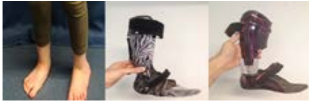
Kuva 3. kävelyn analyysin eri tapahtumat: ilman ortooseja, vanhoilla ortooseilla sekä uusilla ortooseilla

Asiakkaan kävely dokumentoitiin laitteistolla siten, että liikkuminen näkyi kolmesta eri suunnasta; edestä, takaa ja sivulta. Tämä mahdollistaa liikkumisen tarkan