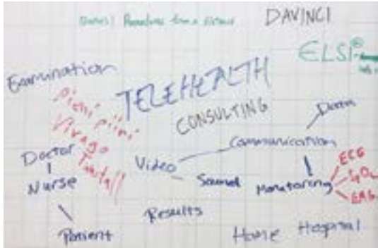
Kuva 2. Pohjatiedot aiheesta Telehealth