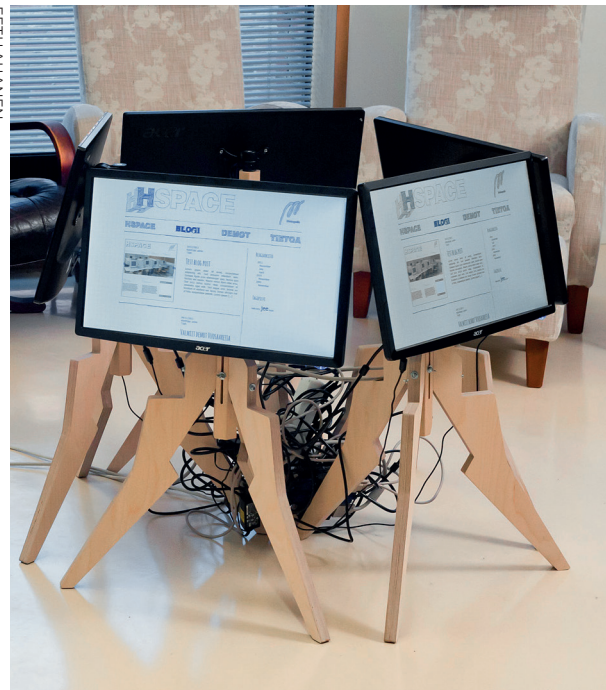
Kuva 1. Ensimmäinen versio Leirinuotiosta.

Koska testiversio oli hajanaisuutensa takia sangen epäkäytännöllinen, keväällä 2012 päätimme Ihanuksen kanssa tehdä seuraavasta versiosta kalustemaisen. Lopulta, muutamien välivaiheiden jälkeen, päädyimme viisikulmion muotoiseen metalliseen pöytään, jossa tarvittava tekniikka voitiin piilottaa pöydän jalan sisään.