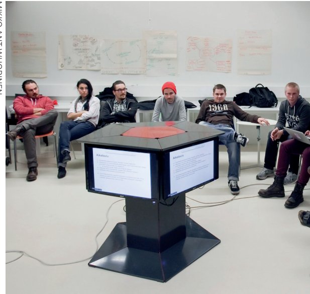
Kuva 2. Leirinuotion toinen versio