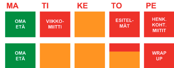
Tuotekehityssimulaation viikkorakenne

Aikataulullisesti viikot seuraavat kurssilla samaa rakennetta koko ajan. Kuva 1 alla havainnollistaa viikkorakennettamme. Vihreä väri on opiskelijan etätöitä, oranssi on itsenäistä työskentelyä ”työpaikalla”, eli Tuotekehityssimulaation toimistolla ja punainen väri sisältää ennalta sovittua toimintaa opettajan kanssa.